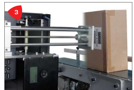
3 Versátil, aplica etiquetas desde arriba, abajo, de forma lateral, en cualquier ángulo de rotación.