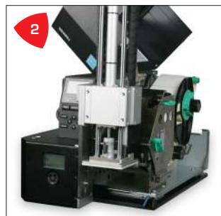
2 Compacto, seguro y de fácil acceso para el usuario.